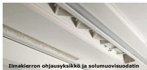
Ilmankierron ohjausyksikkö ja solumuovisuodatin