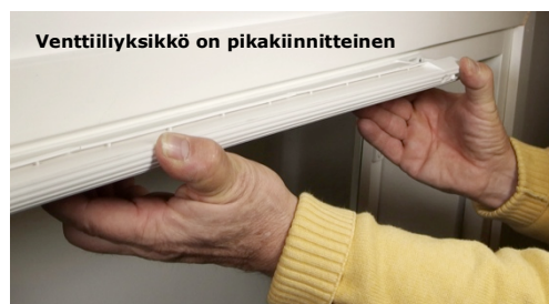
Venttiiliyksikkö on pikakiinnitteinen