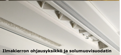
Ilmakierron ohjausyksikkö ja solumuovisuodatin